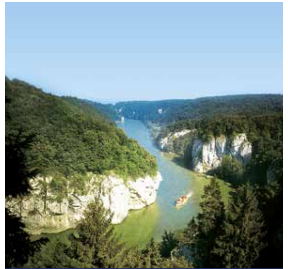
Der Donaudurchbruch ist eine Engstelle des Donautals

Alle Zeiten sind Richtzeiten. Programmänderungen, auch durch Hoch- und Niedrigwasser, oder Verzögerungen bei Schleusendurchfahrten sind vorbehalten. Das Landausflugsprogramm erhalten Sie ca. 6 Wochen vor Reisebeginn. Die Landausflüge sind nicht im Reisepreis enthalten. HT = Halbtagesausflug A = Abendausflug