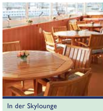
In der Skylounge

Trinkgelder, Landausflüge, zusätzliche Veranstaltungen und private Ausgaben sind nicht im Reisepreis eingeschlossen.