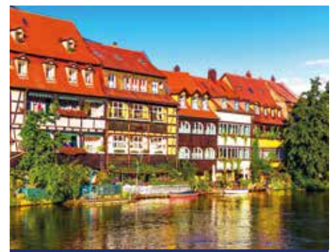
Bamberg: denkmalgeschützte Gebäude, mittelalterlicher Charme und barocke Pracht