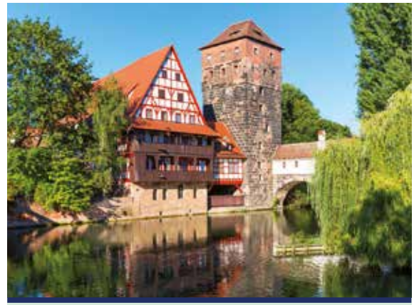
Die Altstadt Nürnbergs ist von mittelalterlicher Architektur, Festungsmauern und Türmen geprägt