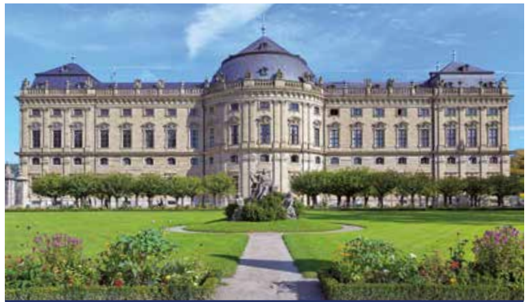
Die Residenz in Würzburg

Ob Donau, Regnitz, Pegnitz, Main oder Rhein – sie alle schenken Ihnen eine neue Perspektive auf Natur und Kultur. In Passau an Bord gekommen, flanieren Sie in Regensburg durchs historische Zentrum oder fahren zum Donaudurchbruch, wo sich die Felswände bis zu 80 Meter hoch in den Himmel strecken. Nachdem Sie in Nürnberg bis zur Kaiserburg geschlendert sind, bewundern Sie in Bamberg das alte Rathaus oder blicken von der Festung Marienberg in Würzburg über herbstbunte Landschaften. Die Welt der Weine in Rüdesheim erleben, in Boppard zur Ruine des Römerkastells spazieren oder in Koblenz die Moselmündung fotografieren – MS ELEGANT LADY bringt Sie überall hin!