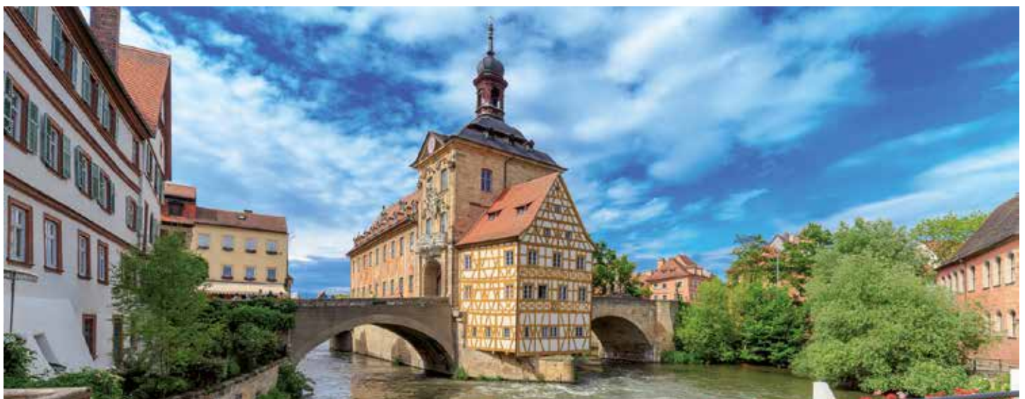
Das Alte Rathaus von Bamberg steht inmitten der Regnitz und ist für jeden Besucher ein Blickfang

Bustransfer von Koblenz nach Passau für € 80,- pro Person zusätzlich buchbar* Für Abonnenten inklusive!