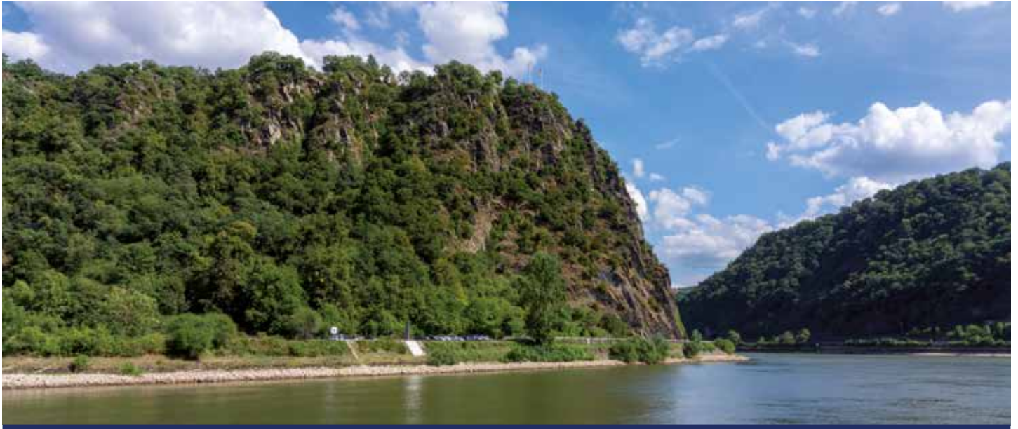
Der sagenumwobene Loreleyfelsen

Ob Donau, Regnitz, Pegnitz, Main oder Rhein – sie alle schenken Ihnen eine neue Perspektive auf Natur und Kultur. In Passau an Bord gekommen, flanieren Sie in Regensburg durchs historische Zentrum oder fahren zum Donaudurchbruch, wo sich die Felswände bis zu 80 Meter hoch in den Himmel strecken. Nachdem Sie in Nürnberg bis zur Kaiserburg geschlendert sind, bewundern Sie in Bamberg das alte Rathaus oder blicken von der Festung Marienberg in Würzburg über herbstbunte Landschaften. Die Welt der Weine in Rüdesheim erleben, in Boppard zur Ruine des Römerkastells spazieren oder in Koblenz die Moselmündung fotografieren – MS ELEGANT LADY bringt Sie überall hin!