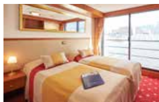
2-Bettkabine mit franz. Balkon