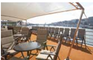
Sonnendeck mit Sonnensegel