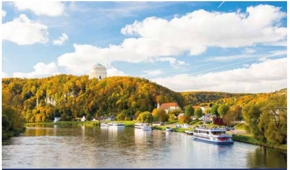
Blick auf Kelheim, die Stadt liegt am Ausgang des Donaudurchbruchs unterhalb des Michelsberges