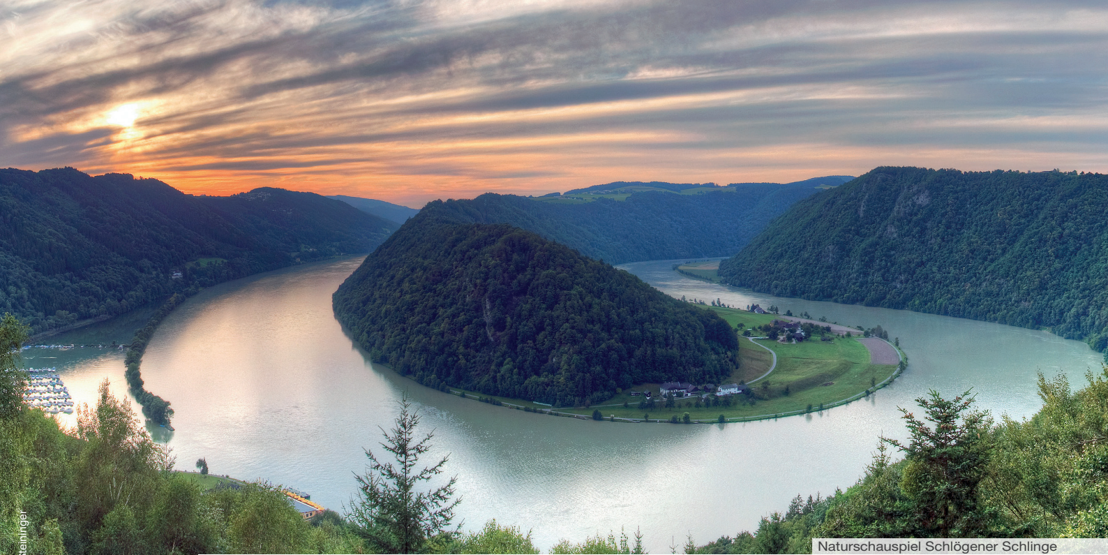
Naturschauspiel Schlägener Schlinge