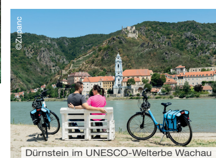
Dürnstein im UNESCO-Welterbe Wachau