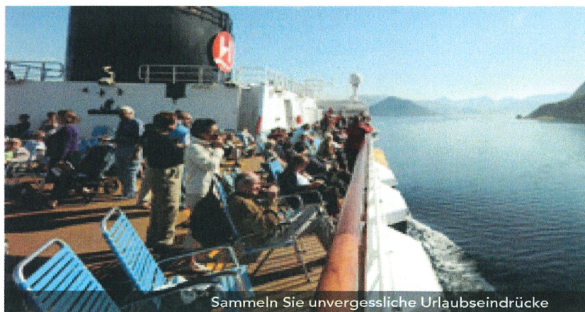
Sammeln Sie unvergessliche Urlaubseindrücke