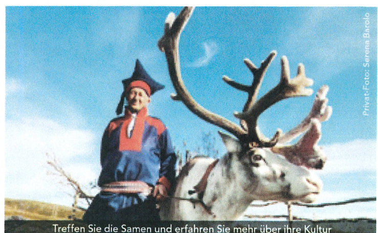
Treffen Sie die Samen und erfahren Sie mehr über ihre Kultur