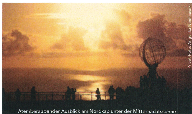
Atemberaubender Ausblick am Nordkap unter der Mitternachtssonne

(Änderungen im Programmablauf vorbehalten)