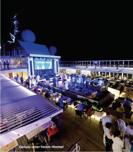
Genuss unter freiem Himmel