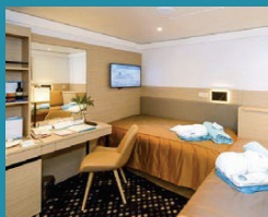
2-Bett, innen, diverse Decks (Kat. D, E, G)