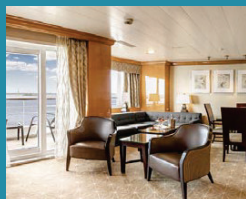
2-Bett, Royal-Suite, Balkon, Panorama-Deck (Kat. W)