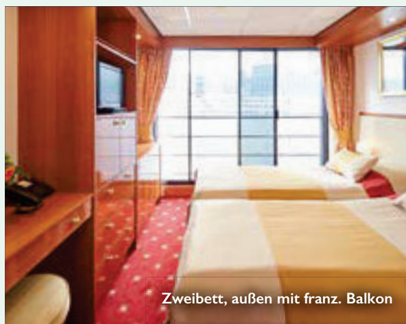
Zweibett, außen mit franz. Balkon