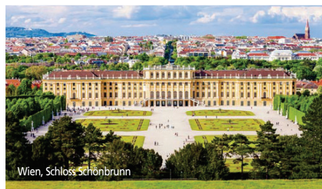
Wien, Schloss Schönbrunn