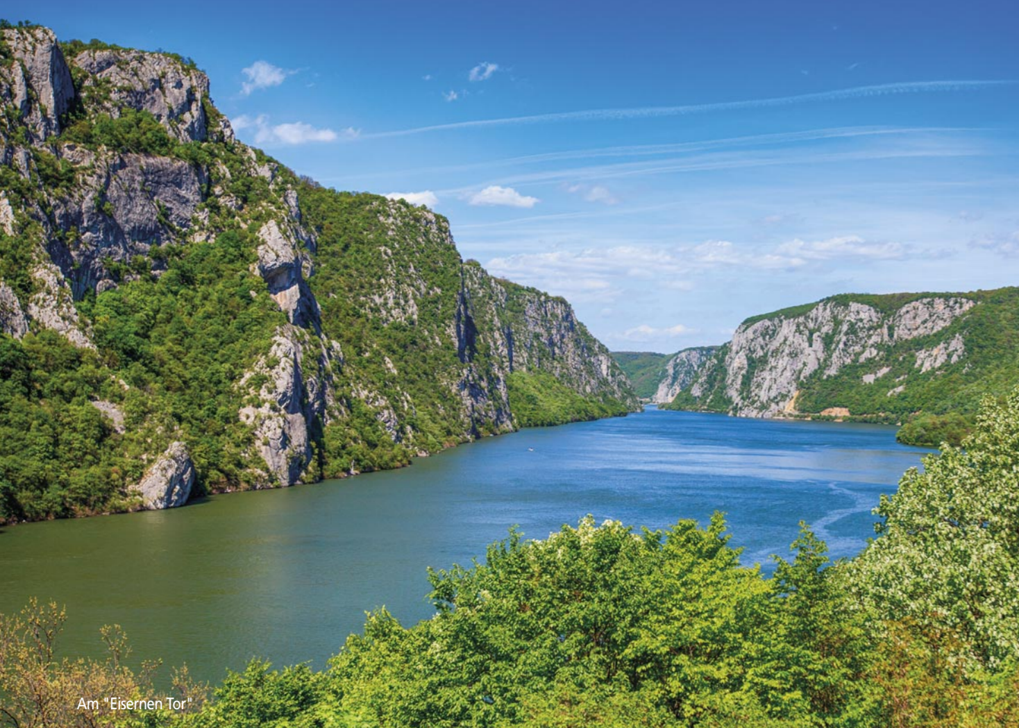
Am "Eisernen Tor"