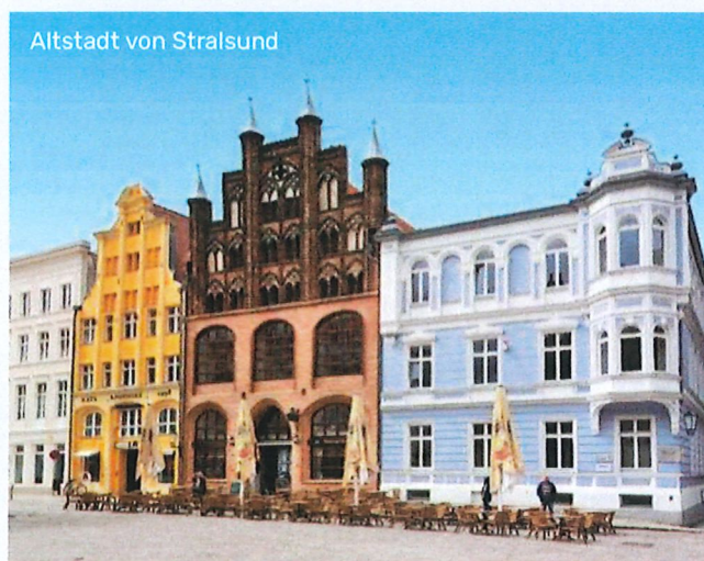
Altstadt von Stralsund

Nachdem Sie einen faszinierten Blick vom Rügener Königstuhl über die Ostsee geworfen haben, fahren Sie über den Greifswalder Bodden, bewundern in Peenemünde das historische U-Boot im Hafen und flanieren durch das charmante Kaiserbad Heringsdorf auf Usedom. Kurzerhand das Stettiner Haff überquert, gehen Sie in Stettin auf Schatzsuche. Was Berlin wohl noch alles zu bieten hat?