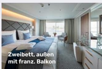
Zweibett, außen mit franz. Balkon