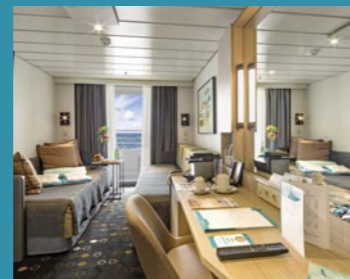
2-Bett-Superior, Balkon, Orion-/Apollo-/Jupiter-Deck (Kat. PS, PG, P, Q, R, Q1)