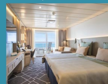
2-Bett-Junior-Suite, Balkon, Jupiter-/Lido-Deck (Kat. S, T)