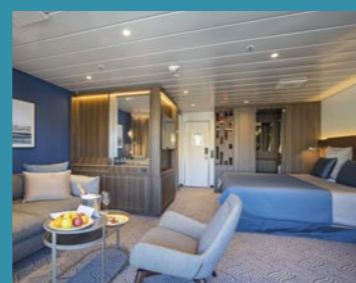
2-Bett-Suite, Balkon, Lido-Deck (Kat. V)