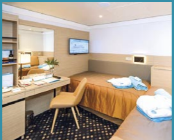
2-Bett, innen, Saturn-, Promenaden-, Apollo-Deck (Kat. D, E, G)