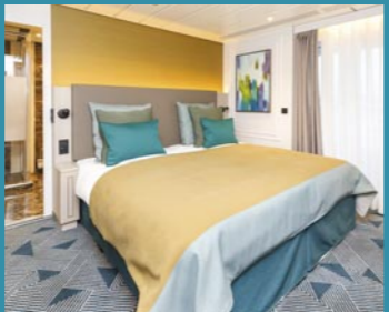
2-Bett, Royal-Suite, Schlafbereich, Balkon, Panorama-Deck (Kat. W)