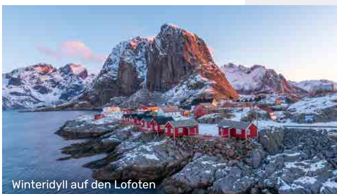
Winteridyll auf den Lofoten