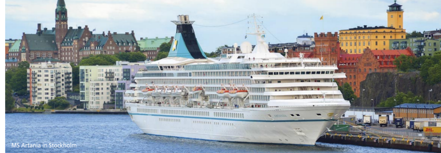
MS Artania in Stockholm